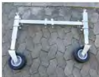
Roues de jauge Kit